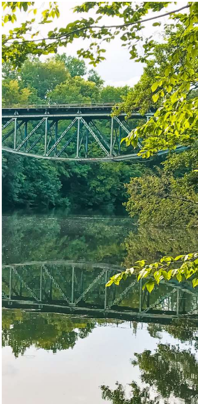
Wiadukt kolejowy w Rutkach