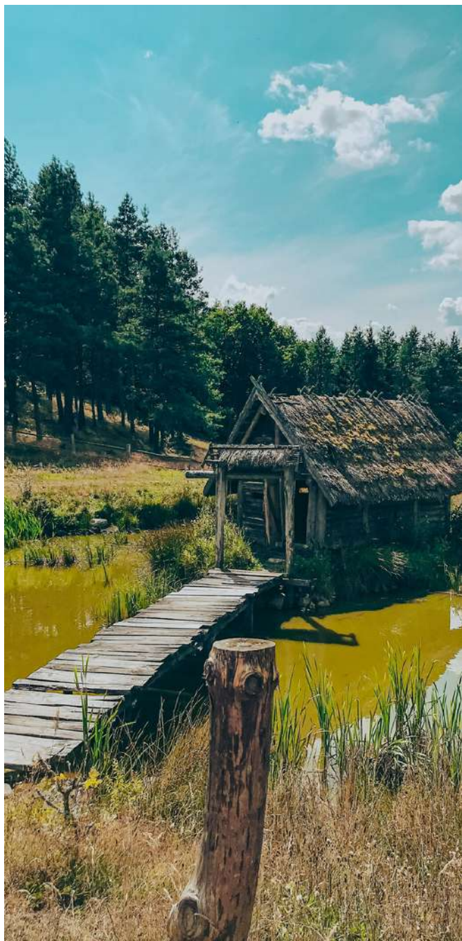
Wioska Gotów w Piasznie