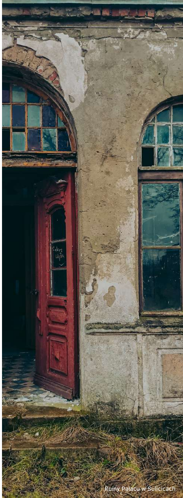
Ruiny Pałacu w Suliczach