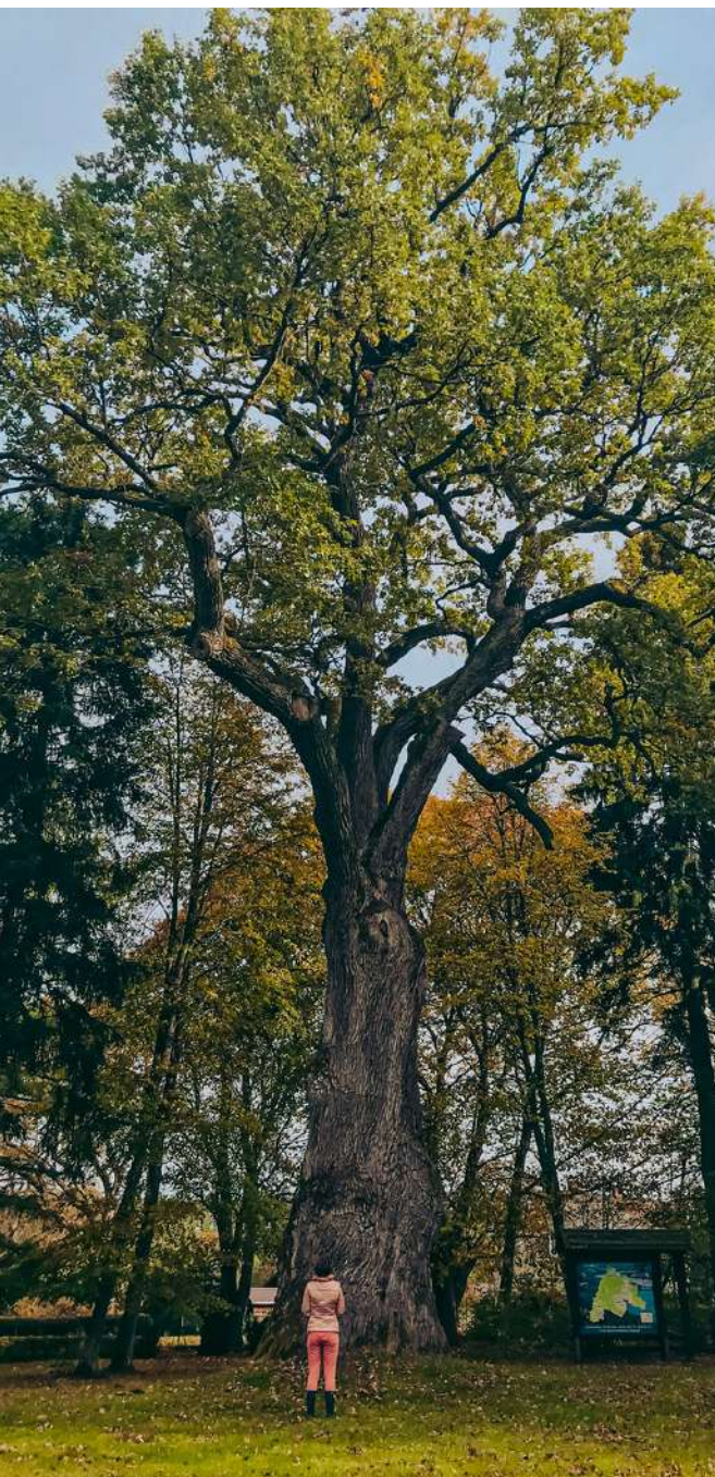
Dąb Łokietka w Lasce